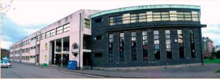
I.E.S. GALILEO GALILEI. NAVIA