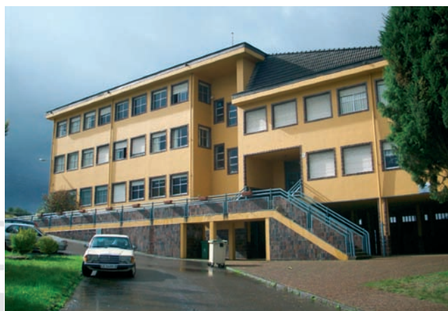
C. P. GRANDA (SIERO).

Lamentamos por tanto, la nula capacidad del MEC para haber regulado en tiempo y forma el CGT de ámbito nacional y las consecuencias por el retraso en su publicación (plazos de petición en pleno periodo vacacional, "negociación" de plantillas...) aparte de las posibles consecuencias negativas sobre los que sacaron plaza por primaria en 2007 y no obtuvieron destino en el CGT de ámbito autonómico, así como para los futu-