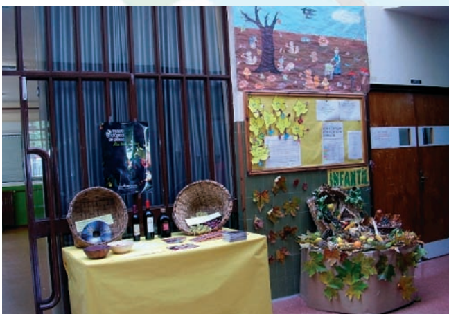
MUSEO DEL VINO.

Al terminar los juegos todos disfrutamos de una merienda otoñal a base de frutos secos en la que, por supuesto, no faltaron las castañas. Pero, como una imagen vale más que mil palabras, os animo a que veáis las fotos de la fiesta.