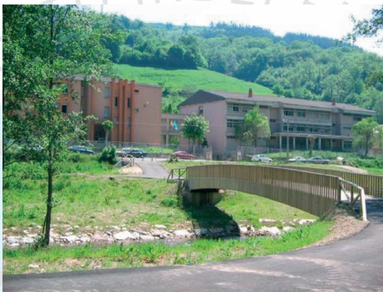
C.P.E.B. POLA DE ALLANDE.

ANPE valora positivamente la desaparición del CAP, que se había manifestado insuficiente como preparación pedagógica, pero lamenta la oportunidad perdida de establecer un máster de dos años, similar al resto de estudios de posgrado de la mayoría de las titulaciones superiores.