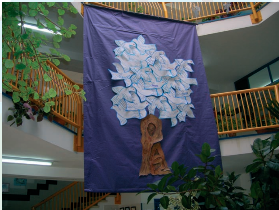
C.P. El Vallín (Avilés)

Durante este día los centros realizaron actividades didácticas relacionadas con la paz y el entendimiento entre personas de distinta formación, raza, cultura y religión. En el C.P. El Vallín de Avilés el día de la paz, se celebró en el interior del centro y durante el acto se creó "el árbol de la paz"