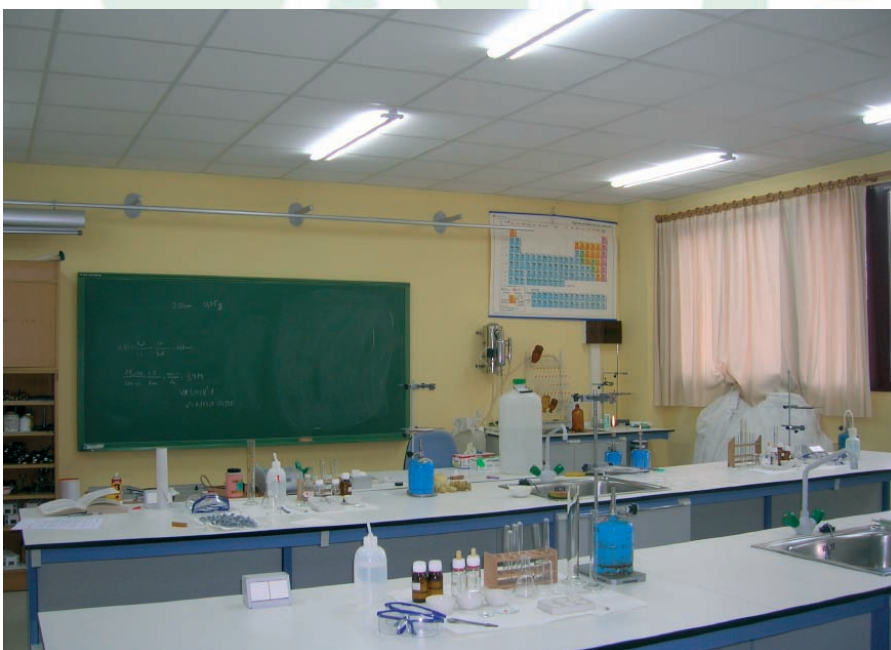
IES Leopoldo Alas. Laboratorio.

Desde la Administración se comunica que se hizo el abono a 1300 inte-