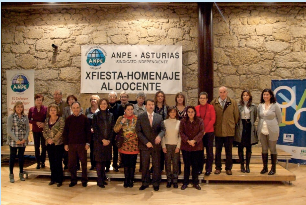
Foto: XI ENCUENTRO DE HOMENAJE AL DOCENTE ANPE -ASTURIAS

DESEAMOS CONTRIBUIR A UN MAYOR RECONOCIMIENTO SOCIAL DE NUESTRA PROFESIÓN